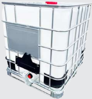
원색(백색) [비중 1.9]