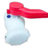
50DN 볼밸브 캠록