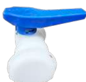
80DN 버터플라이 캠록