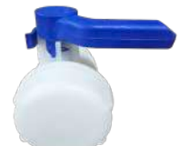
3인치 밸브 버터플라이