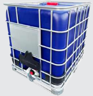
청색(UV차단 70%) [비중 1.5]