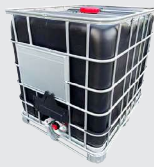
흑색(UV차단 90%) [비중 1.5]